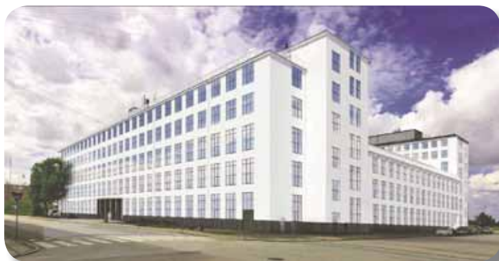
Sådan kommer Philips gamle bygning til at se ud...!

Fra min ansættelse i 1966 var arbejdsadressen Prags Boulevard 80... ...men 1999 flyttede Philips til Frederikskaj i Syd-vest kvarteret, og Amerageradressen var en saga blot.