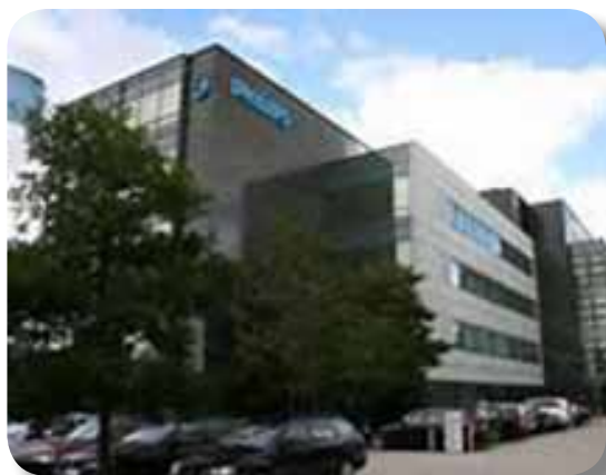
Frederikskaj 6 - 2450 København SV

Fra min ansættelse i 1966 var arbejdsadressen Prags Boulevard 80... ...men 1999 flyttede Philips til Frederikskaj i Syd-vest kvarteret, og Amerageradressen var en saga blot.