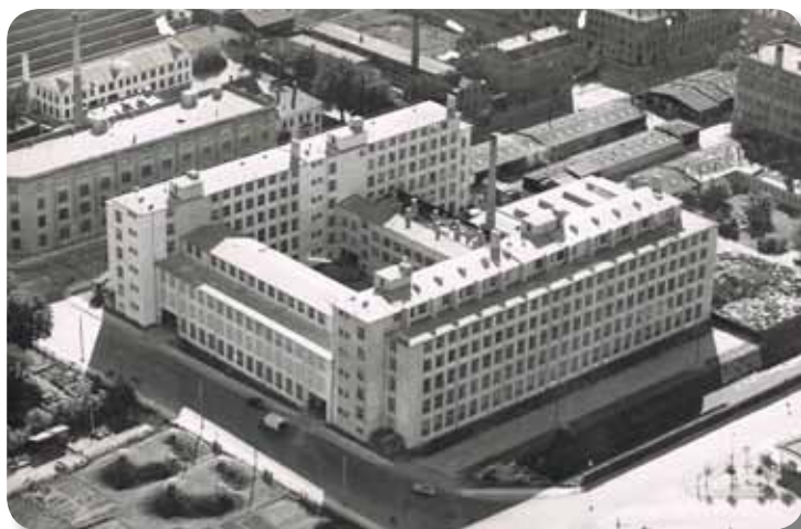
Prags Boulevard 80 - 2300 København S

I 1997 blev vi slået sammen med Reklameafdelingen, og ny læreproces, som DTP kom i spil.